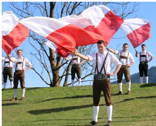
Abb. 2: Beispiel eines ordentlichen Auftretens